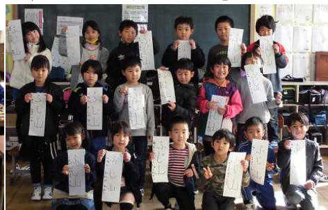
↑ 1年生: 「ふじ山」