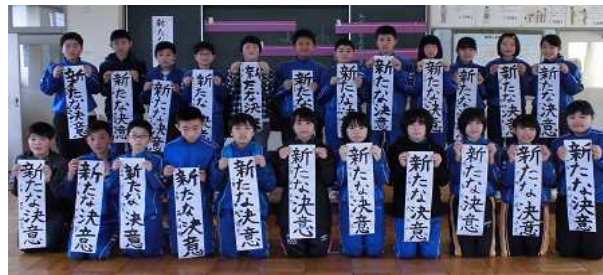
↑ 6年生: 「新たな決意」