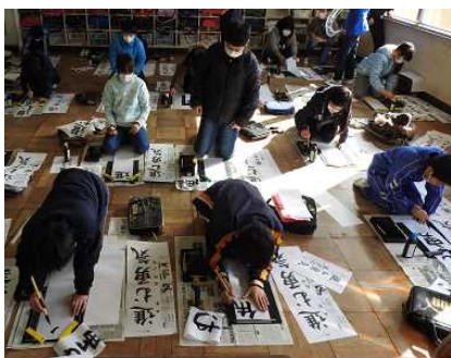
↑ 5年生: 「進む勇気」