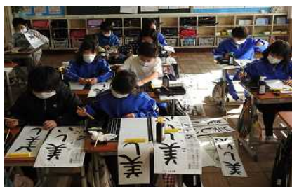
↑ 3年: 「美しい心」