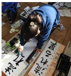
↑ 4年: 「流れる星」